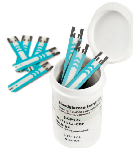
Maakt gebruik van TD-4360 teststrips

Als u beschikt over een smartphone, dan kunt u de GlucoCheck app™ gebruiken om de resultaten van uw TD-Gluco Bluetooth® bloedglucosecontrolesysteem te beheren. De koppeling tussen uw meter en uw smartphone vindt plaats via Bluetooth®. De GlucoCheck app™ is geschikt voor iOS en Android. Via onderstaande links kunt u de juiste versie downloaden.